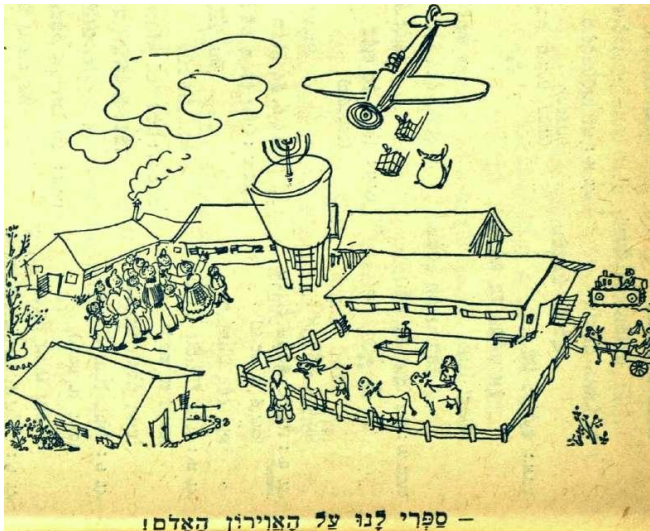
— ספרי לנו על האווירון האדום

(יש להקליד בתיבת החיפוש: "האווירון האדום")